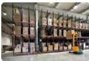
Dịch vụ kho Warehousing