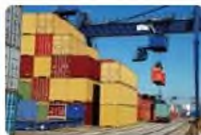
Cảng thông quan nội địa Inland clearance depot (ICD)