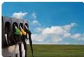
Kinh doanh xăng dầu Petroleum Trading