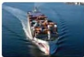
Vận tải quốc tế International freight forwarder